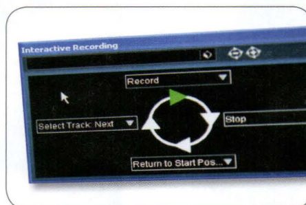
KLIKK MED FOTBRYTER: Slik ser vinduet for Interactive Recording ut.

Yamaha har kjøpt Steinberg, og CI2 er et resultat av dette hardware/software-samarbeidet. ■